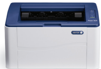
Phaser 3020. Imprimare.